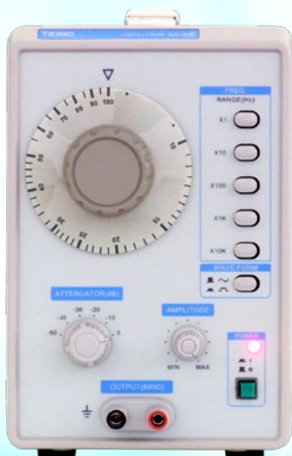
1MHz 低周波発振器 AG-205 ¥ 35,000 (税抜価格)