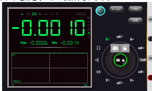
カメラ/ロックアイコン長押し時表示